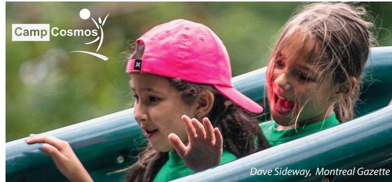
Dave Sideway, Montreal Gazette