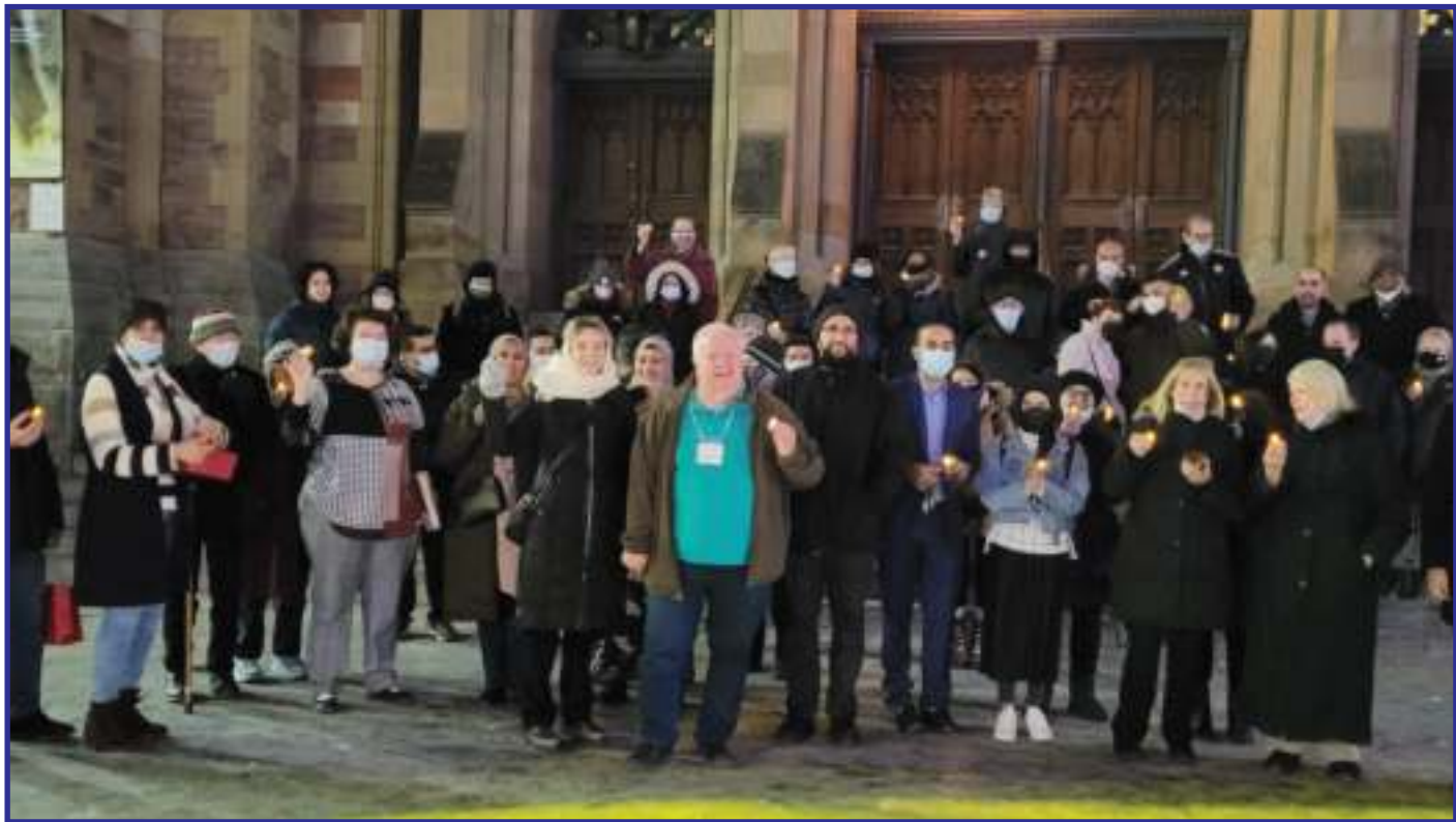
Un ministère communautaire de l'Église Unie du Canada

Montreal City Mission communautaire de Montréal